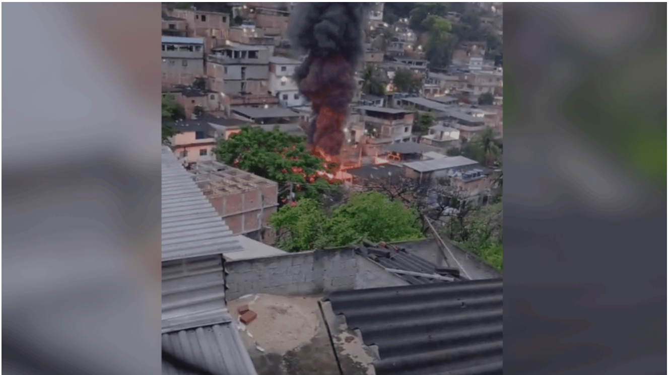
Segundo o governo do estado, a ação dos criminosos aconteceu "em represália à atuação das polícias na região".