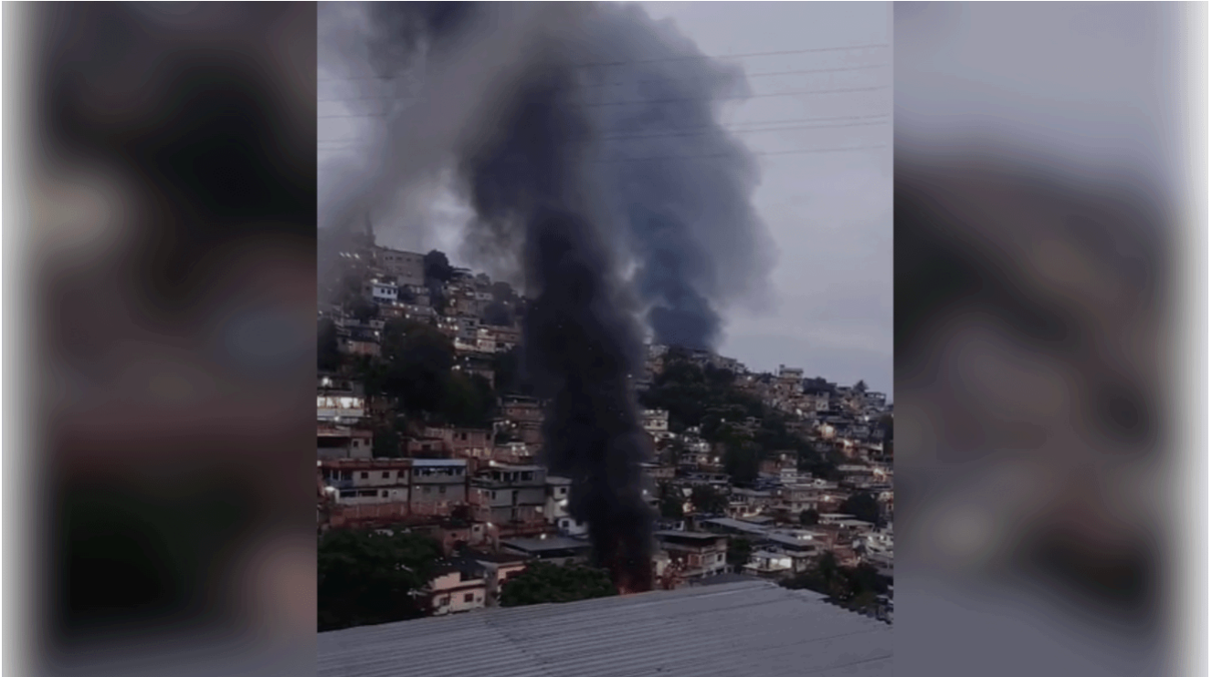
Nos registros, é possível ver locais onde ocorrem os confrontos cobertos de fumaça