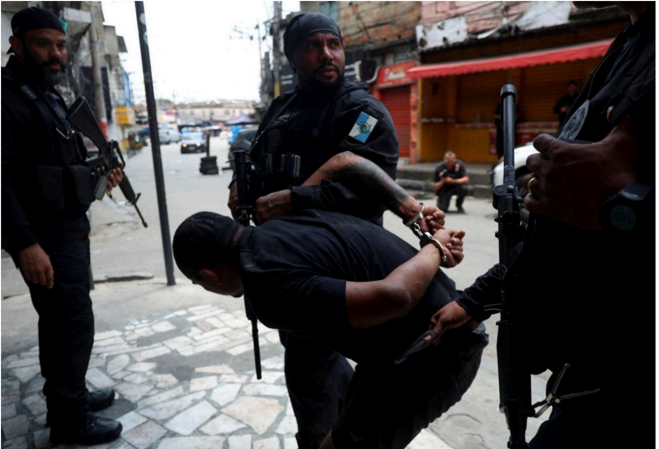
Ao menos dois Policiais civis e 18 criminosos morreram