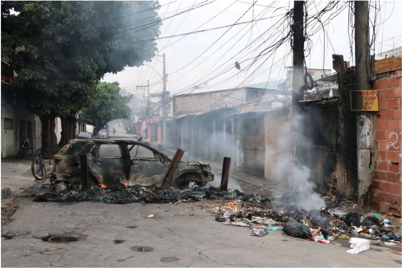
A polícia também apreendeu dez fuzis, uma pistola, três celulares e nove motos.