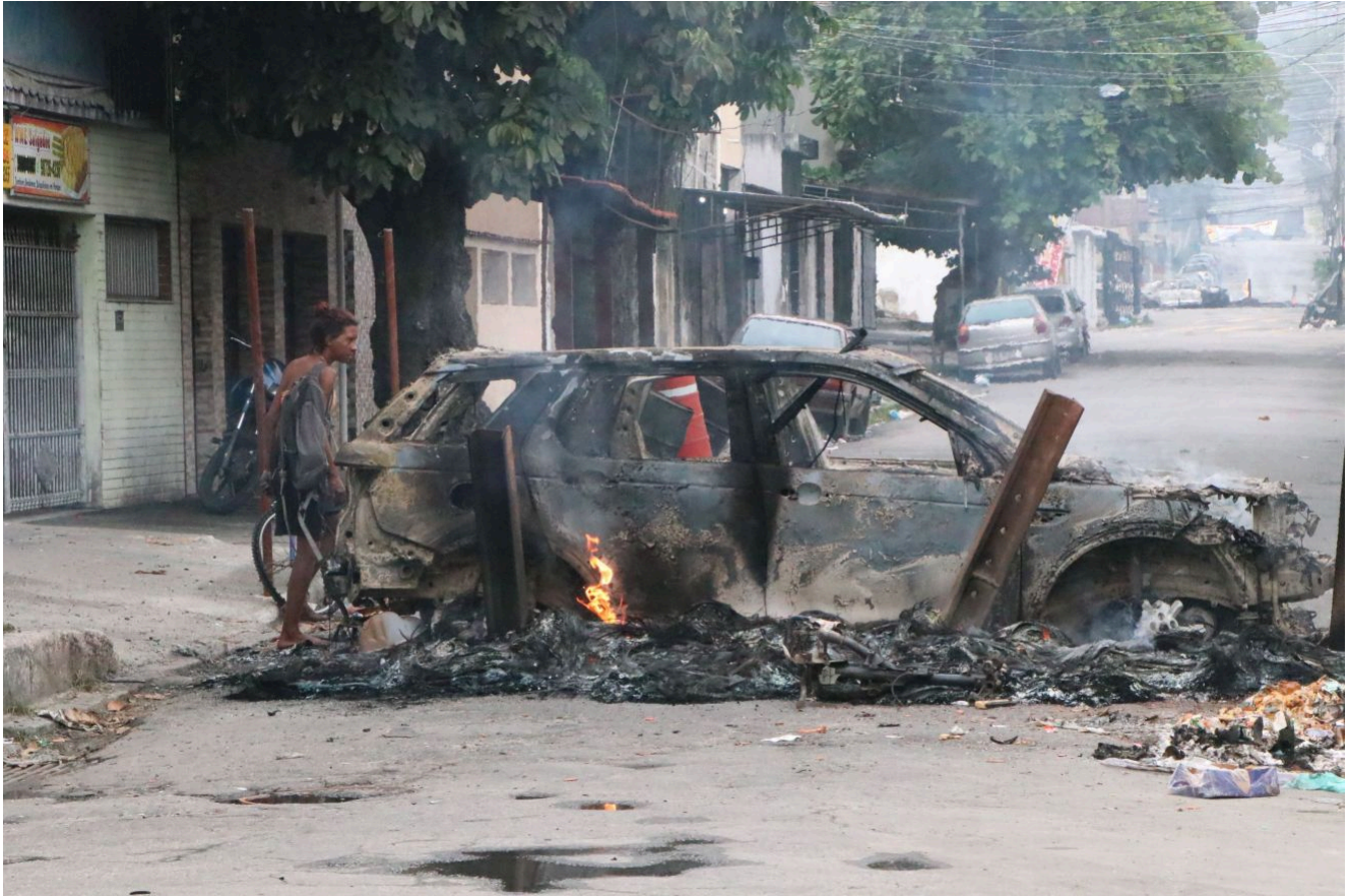
Segundo o Governo do Rio, a operação desta terça-feira é a maior em 15 anos.