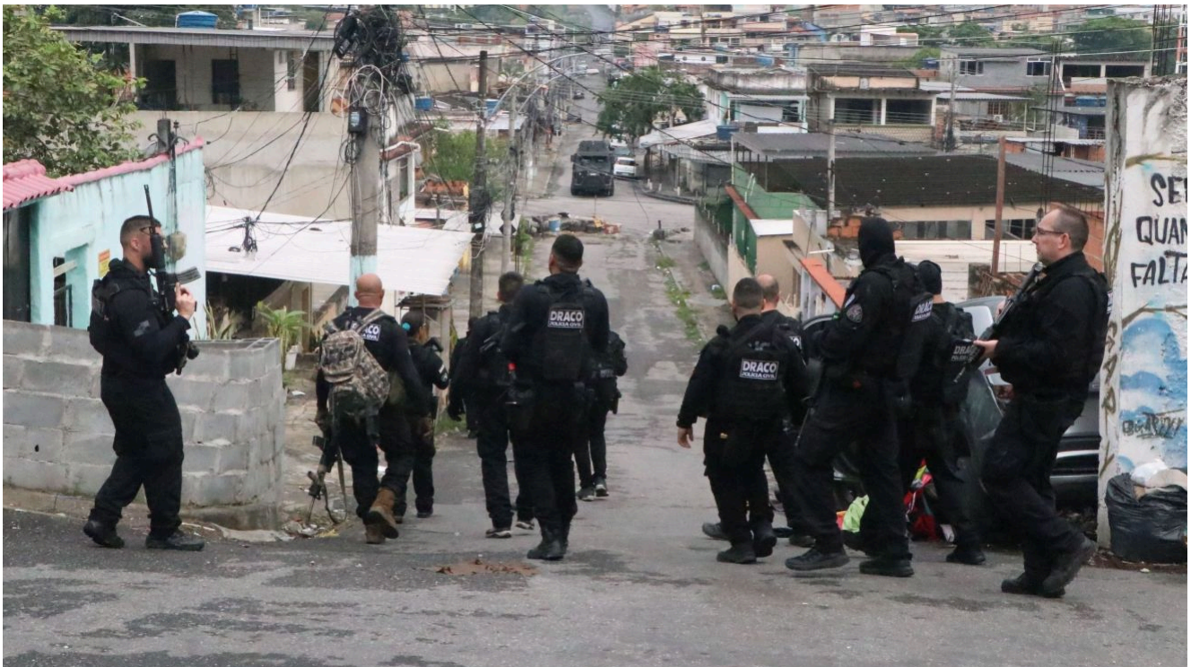
Megaoperação envolve cerca de 2.500 policiais civis e militares é deflagrada nos complexos da Penha e do Alemão, na Zona Norte do Rio de Janeiro, nesta terça-feira (28)