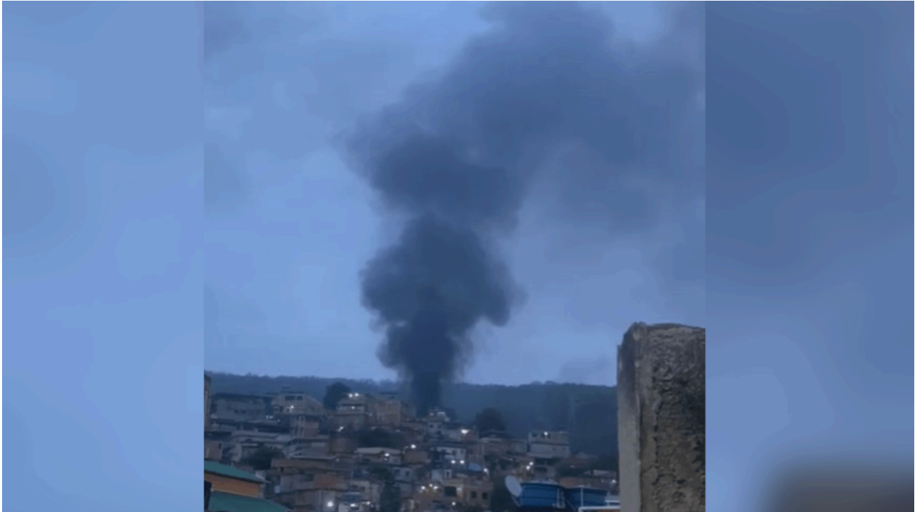
A ação, batizada de Operação Contenção, faz parte de uma iniciativa do Governo do Estado para combater a expansão territorial do CV (Comando Vermelho)