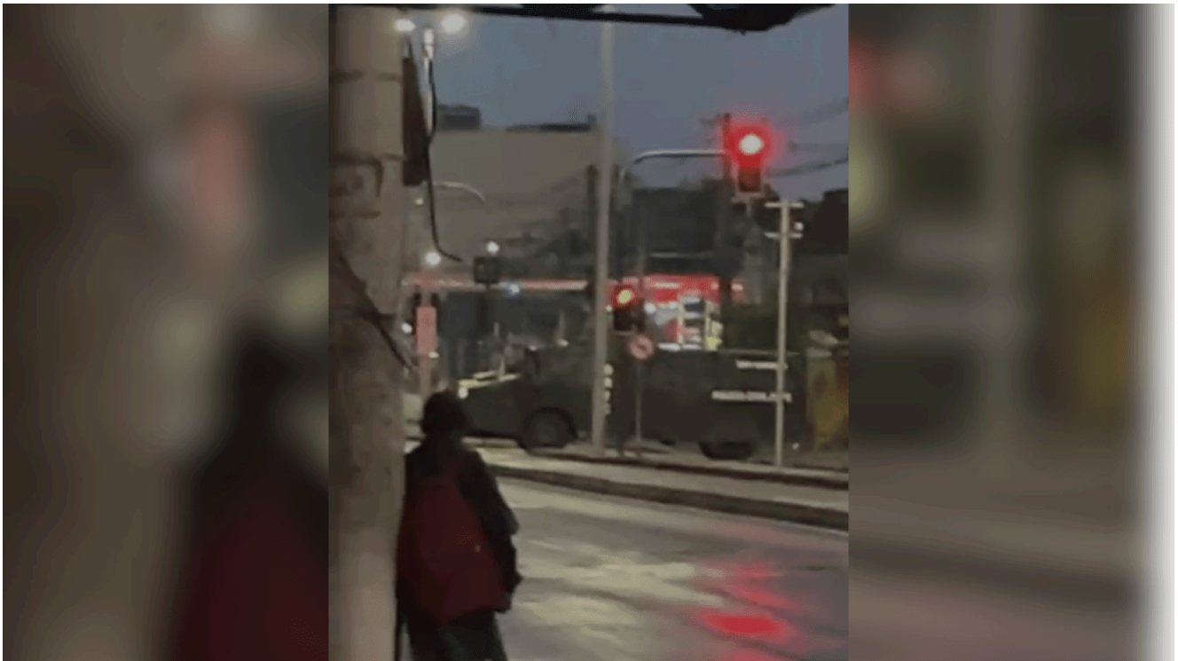
Essa é, segundo o governo carioca, a maior operação da história do estado.