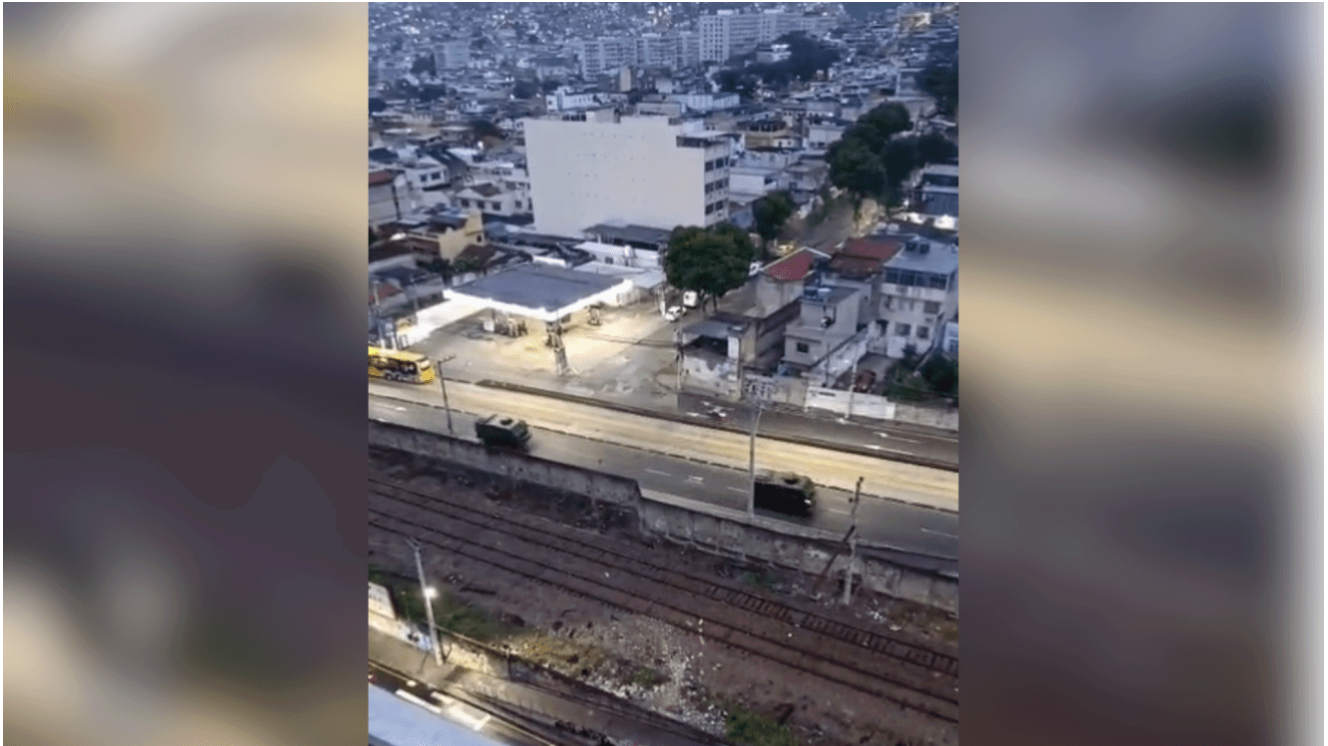
Até o começo desta tarde, 81 pessoas já tinham sido presas.