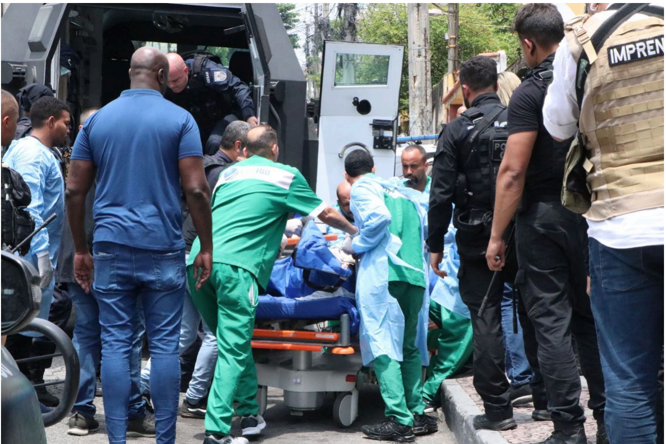
Baleados durante a Operação Contenção chegam ao Hospital Getúlio Vargas, na Penha