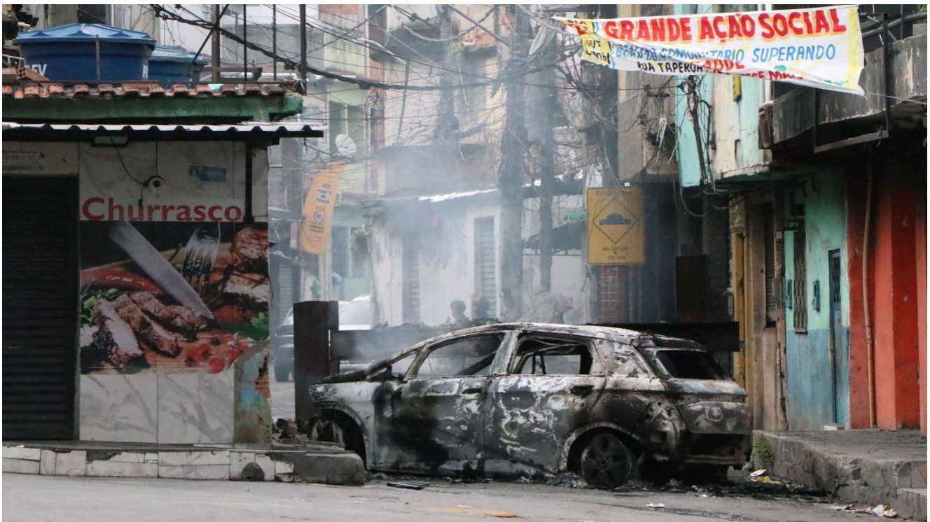
Os policiais tentam cumprir 100 mandados de prisão contra integrantes do CV — entre os alvos, 30 são de outros estados, com destaque para membros da facção no Pará, que estariam escondidos nessas regiões.