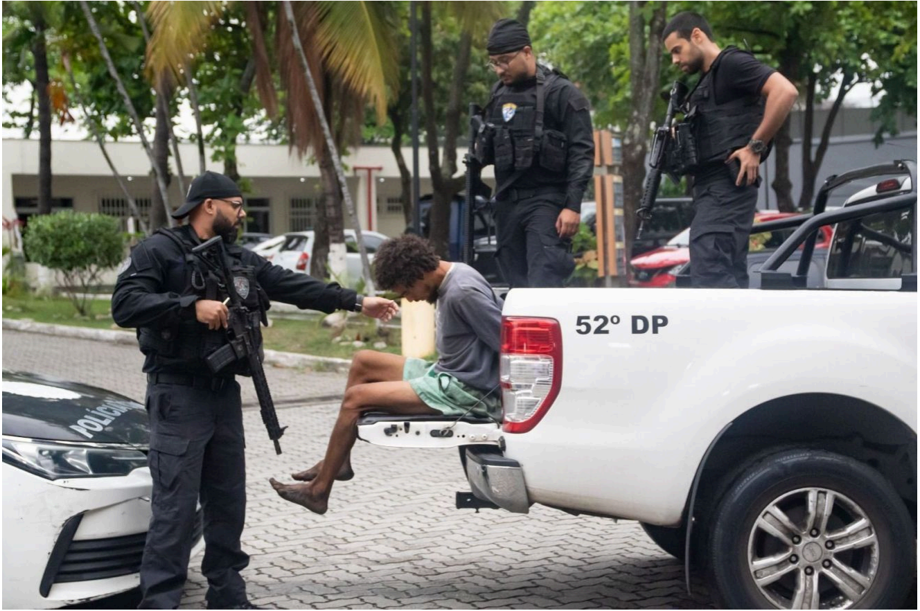
Forças de Segurança do Rio realizam uma Operação nos Complexo da Penha e Alemão, com o objetivo de prender lideranças criminosas