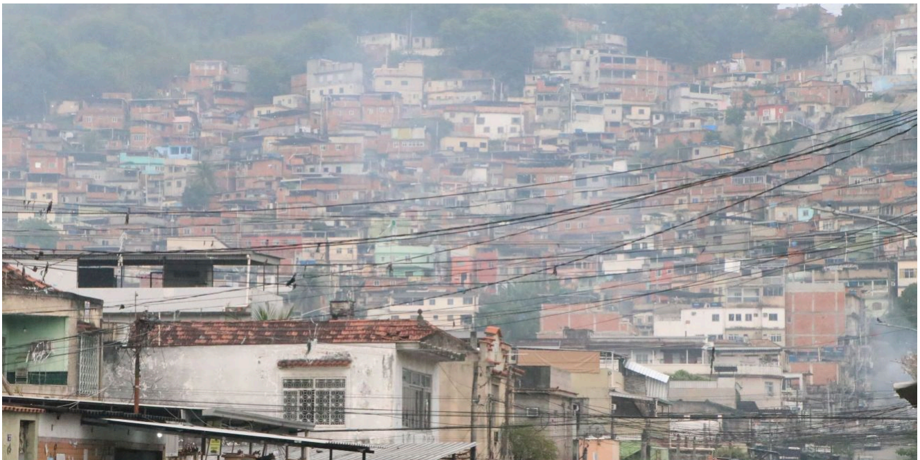
Megaoperação envolvendo cerca de 2.500 policiais civis e militares é deflagrada nos complexos da Penha e do Alemão, na Zona Norte do Rio de Janeiro, nesta terça- feira (28)