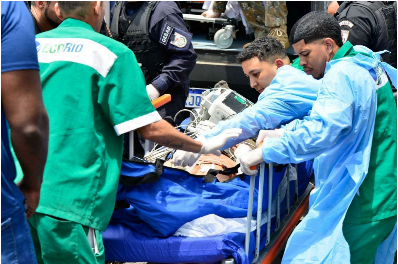
Os dois complexos abrigam 26 comunidades