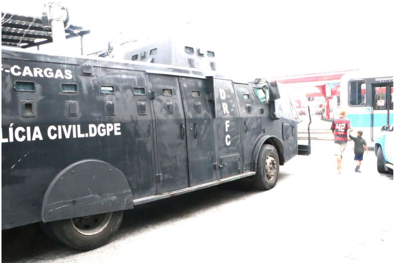
Um policial do Bope foi baleado de raspão na perna durante uma incursão na área de mata do Complexo do Alemão.