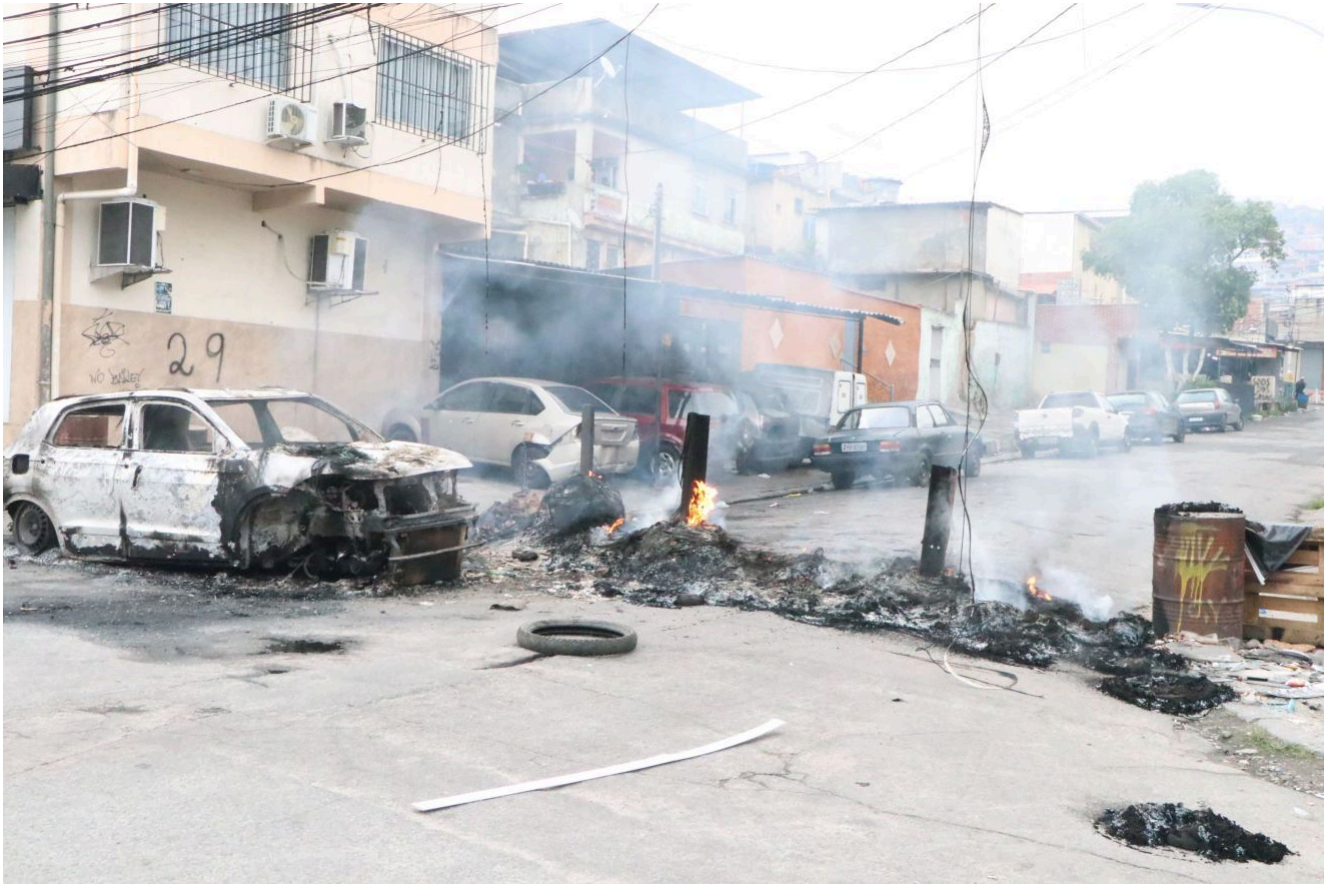
Até o momento, foram confirmadas 64 mortes. Como a ação ainda está em andamento, o número pode aumentar. Em maio de 2021, uma operação no Jacarezinho causou 28 óbitos.