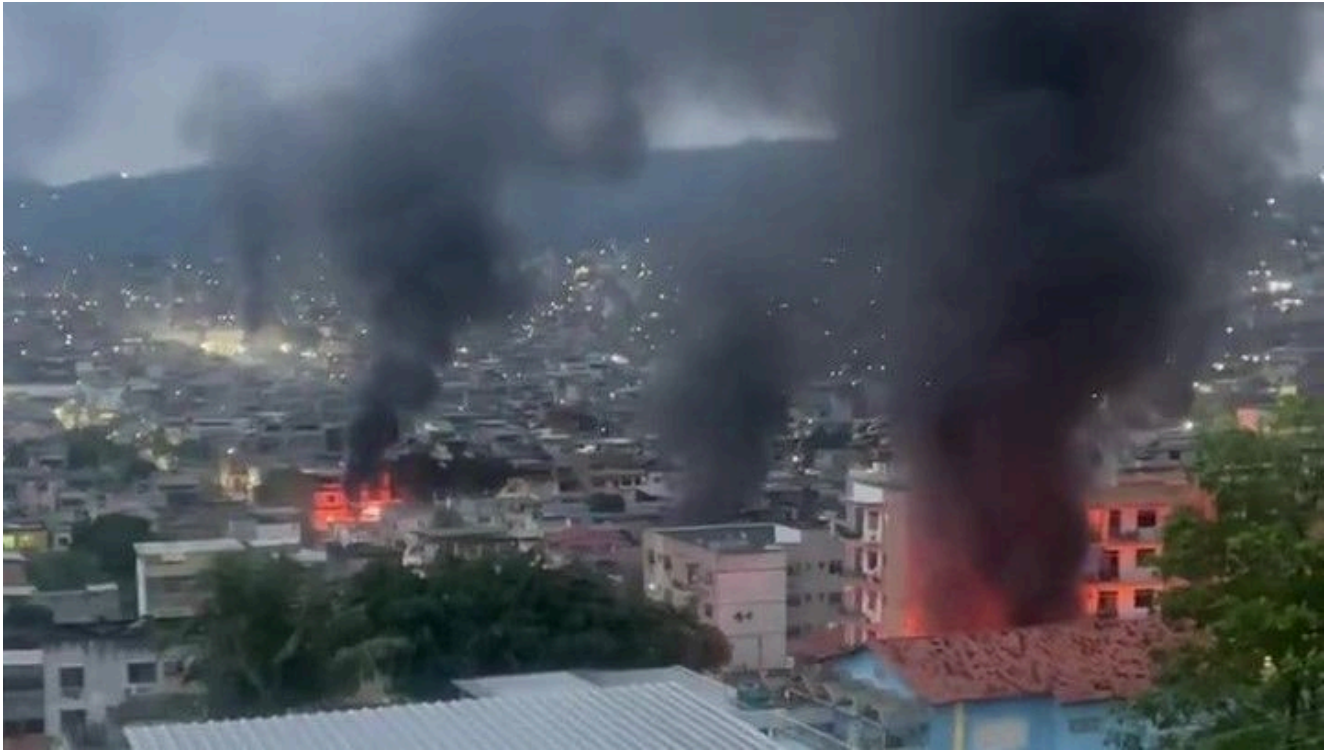
Megaoperação nos complexos do Alemão e da Penha tenta prender traficantes do Comando Vermelho