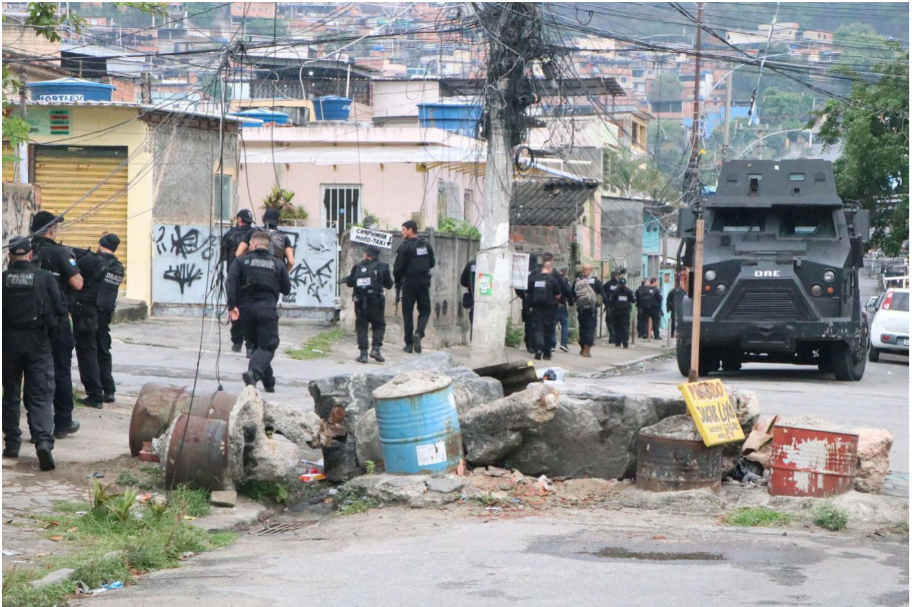
Batizada de "Operação Contenção", a ação visa capturar lideranças criminosas do Rio e de outros Estados e combater a expansão territorial do Comando Vermelho.