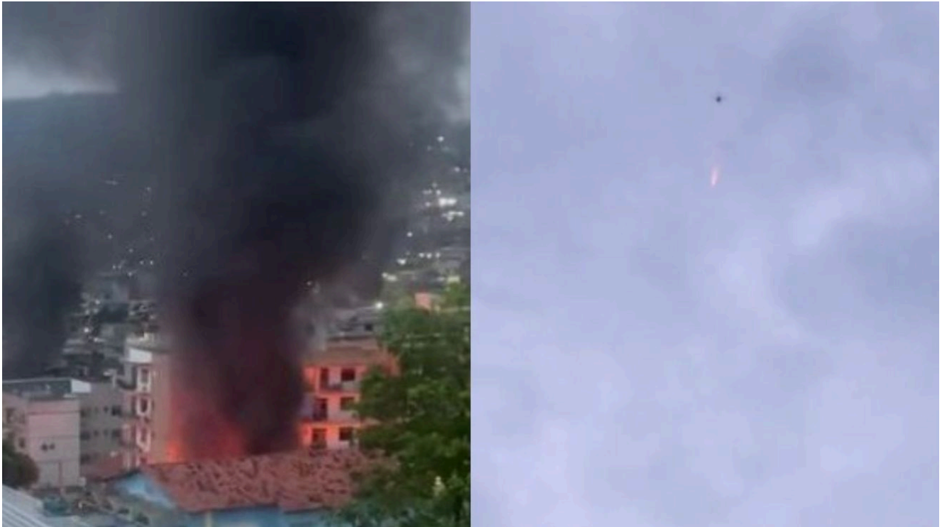
Drone é flagrado arremessando bomba em comunidade; megaoperação tenta prender 100 integrantes do Comando Vermelho