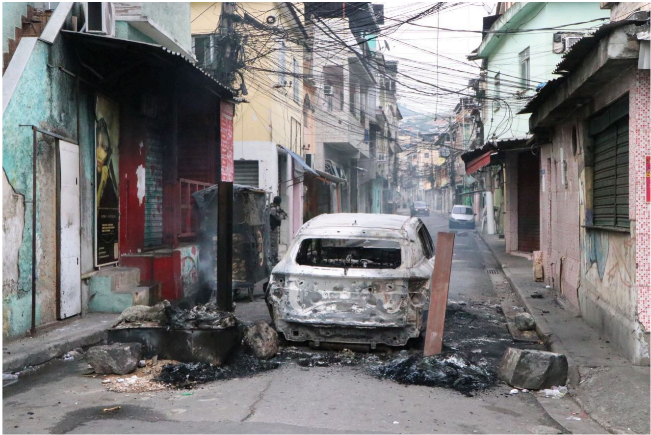
Megaoperação no Alemão e na Penha é a mais letal do RJ, aponta grupo da UFF