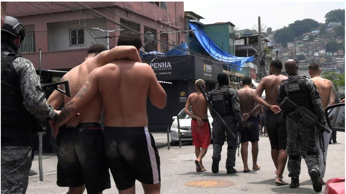
Policiais conduzem suspeitos detidos em uma megaoperação que envolveu cerca de 2.500 policiais civis e militares é nos complexos da Penha e do Alemão