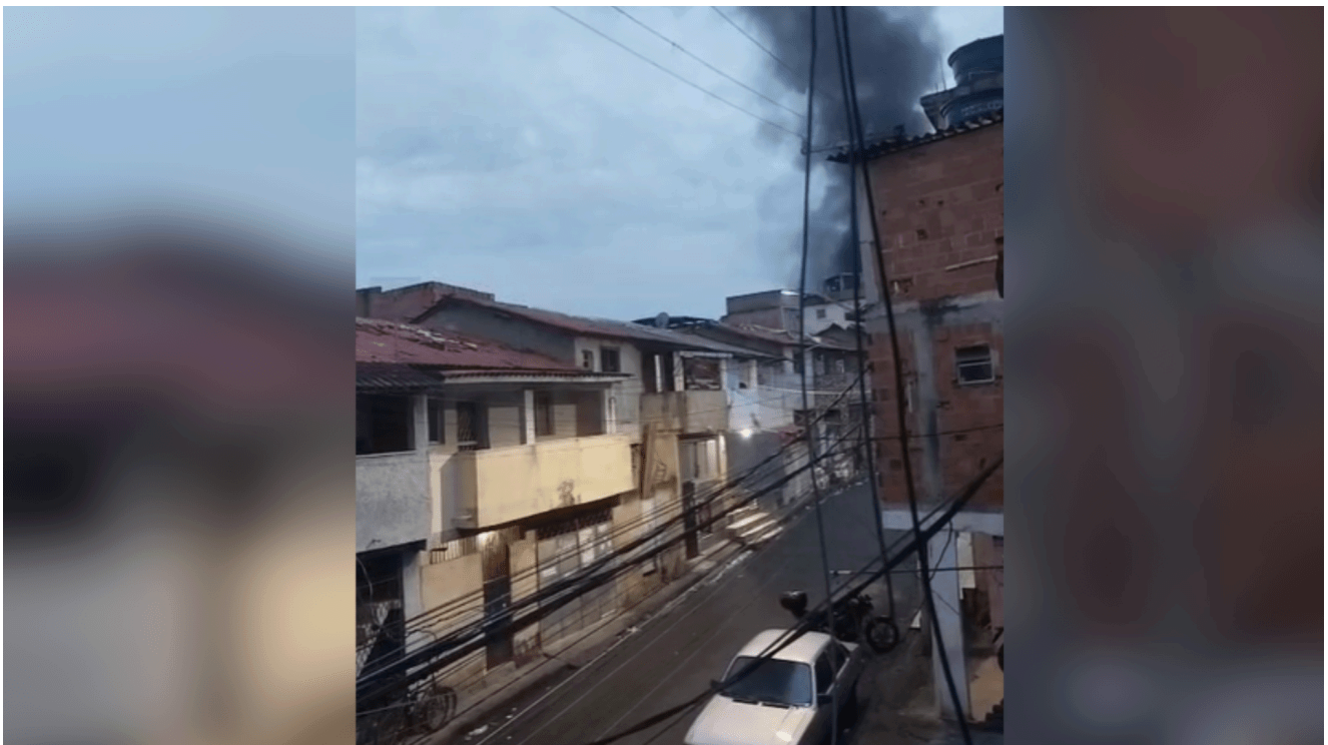
Até a última atualização, dois suspeitos da Bahia foram mortos no confronto e outros dois homens baleados estão sob custódia no Hospital da Penha.