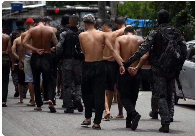
Megaoperação contra CV prende mais de 80 no Rio