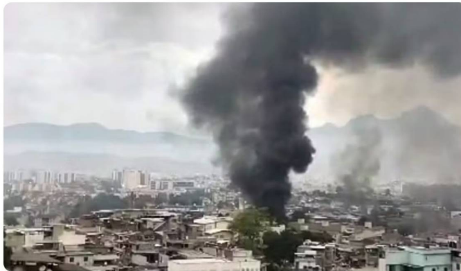
Barricadas em chamas em reação à Operação Contenção