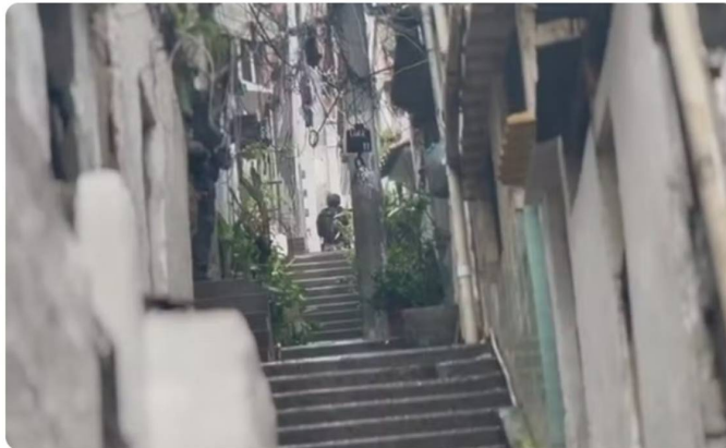
Agentes das forças de segurança em escadaria no Complexo do Alemão