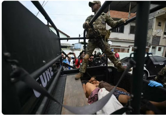
Corpos são transportados em veículo da Polícia Civil após operação contra o CV na Penha, no Rio - 28/10/2025