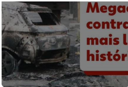
Cenas de guerra: megaoperação contra facção é a mais letal da história do RJ

Em função dos múltiplos bloqueios, o Centro de Operações e Resiliência (COR) do Rio elevou o estágio operacional da cidade para o nível 2 , de uma escala de 5. A PM mandou colocar todo o efetivo na rua — para tal, suspendeu as atividades administrativas.