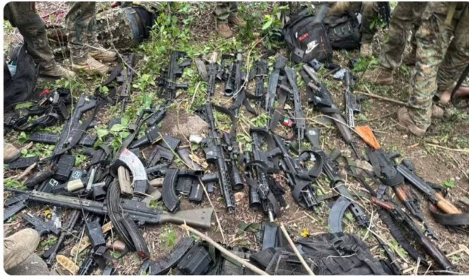
Megaoperação no Alemão e na Penha tem apreensão de 93 fuzis e faz número anual bater 686 — Foto: Reprodução TV Globo