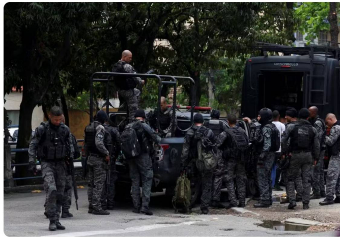
Policiais do Bope atuam em operação na Penha - 28/10/2025